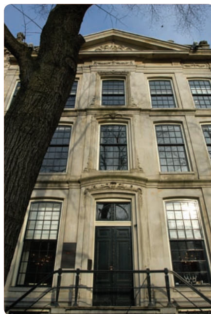
Het monumentale hoofdkantoor van Wijs & van Oostveen

Sinds juli 2008 is het systeem gefaseerd ingevoerd waarbij het bestaande systeem werd vervangen. Toen hebben de bedrijven